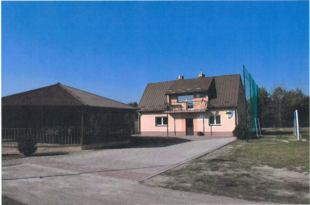
stadion LKS „Huragan” w Gniewczyźnie Trynieckiej