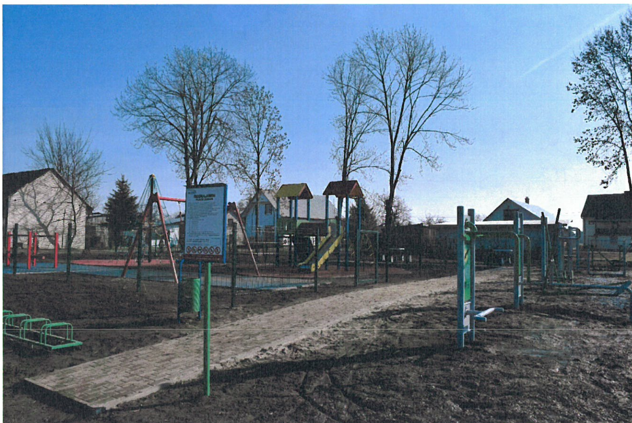
Otwarta Strefa Aktywności w Gniewczynie Trynieckiej