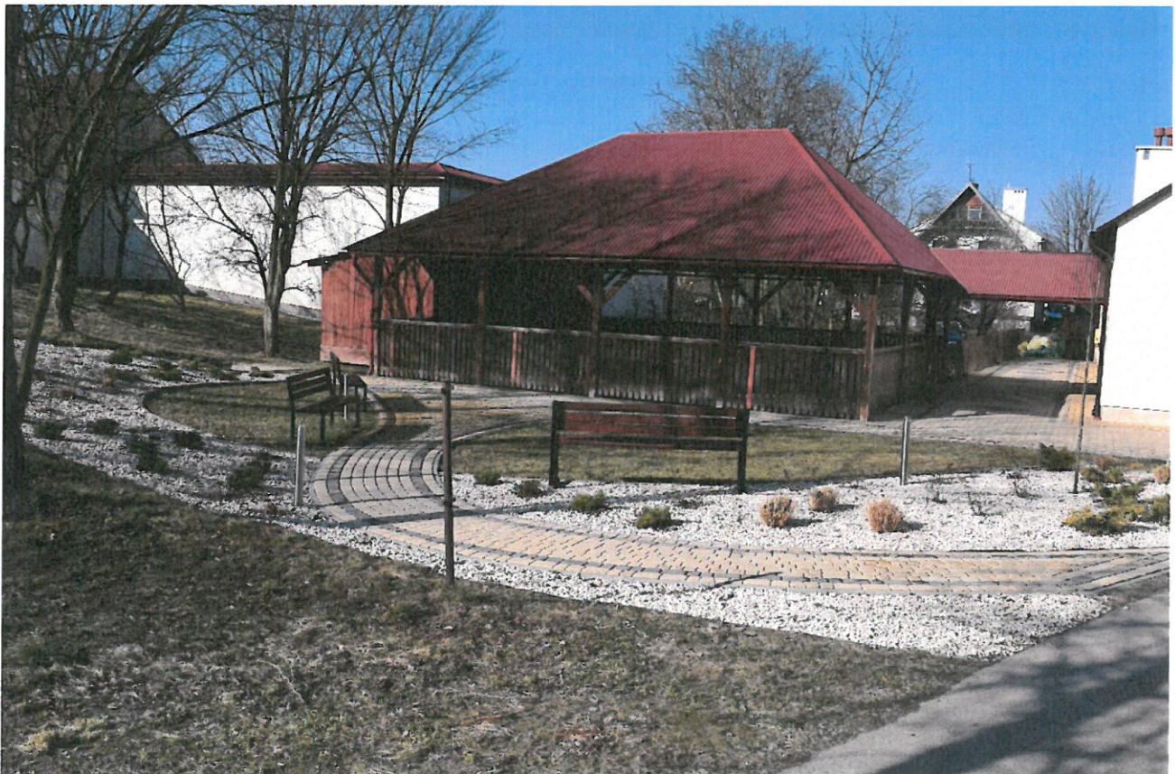
Zagospodarowanie terenu przy WDK w Gniewczynie Trynieckiej