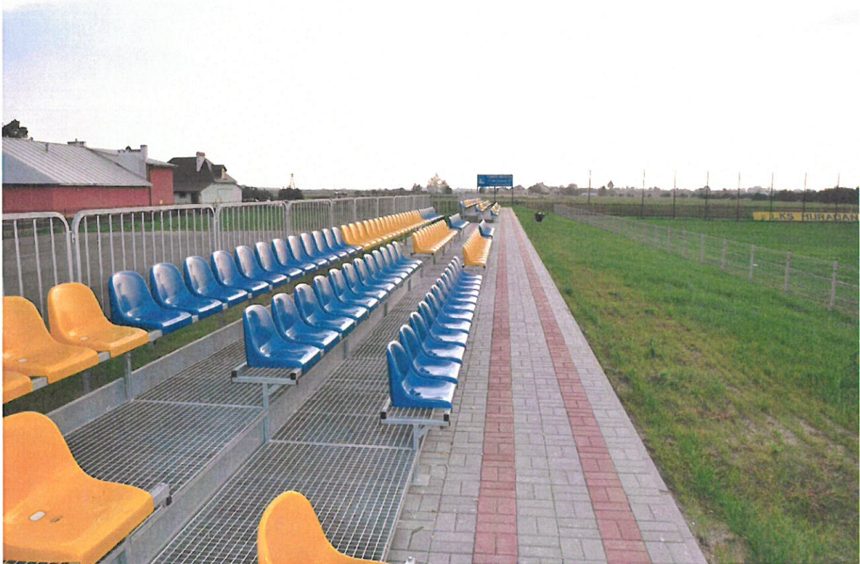
Stadion LKS „Huragan” w Gniewczyźnie Trynieckiej