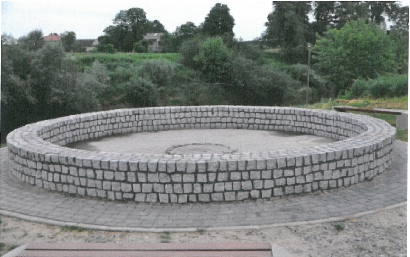
Przystań kajakowa w Gniewczynie Trynieckiej