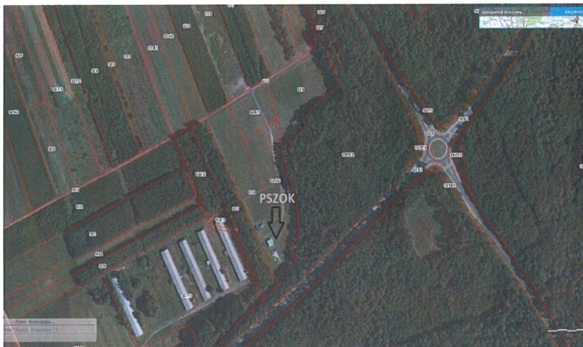
Rysunek 1 Geograficzne położenie PSZOK-u

Na terenie PSZOK zostały wzniesione wiaty na odpady niebezpieczne i wielkogabarytowe, wybudowano pomieszczenie socjalne, kompostownik na odpady biodegradowalne oraz dokupiono/wypożyczono punkt w dodatkowe kontenery m.in. na odpady medyczne, odpady niebezpieczne, na świetlówki oraz kontenery 110 l. na papier, odpady wielomateriałowe. Zakupiono również regały na drobny sprzęt elektryczny i elektroniczny. Kupno dalszego wyposażenia m.in. wagi oraz wyposażenie budynku socjalnego a także kontynuacja pozostałych prac zaplanowana jest w rozbiciu na najbliższe lata. Planowane jest również utwardzenie placu, zamontowanie dwóch bram wjazdowych oraz oznakowanie (znaki drogowe, informacyjne oraz regulamin) placu. Ponadto na PSZOKu zamontowano całodobowy monitoring mający ograniczyć podrzucanie odpadów poza godzinami otwarcia punktu.