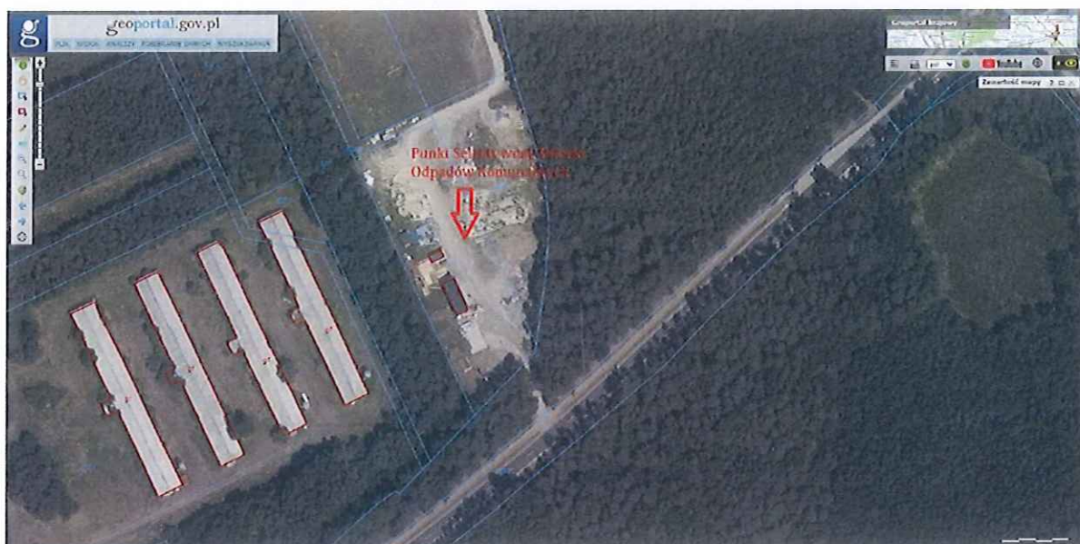
Rysunek 1 Geograficzne położenie PSZOK-u